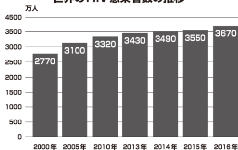
世界のHIV感染者数の推移

日本では今までに約27000人がHIVに感染またはエイズと診断されている。(2016年累計)