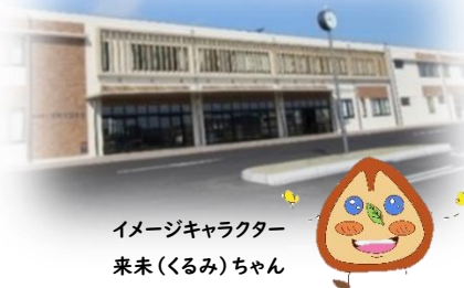
イメージキャラクター 来未(くるみ)ちゃん